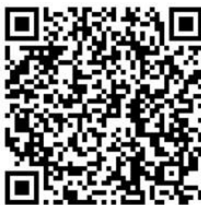
Рисунок 4 — Сценарий для проведения дебатов «Идеология радикализма»

Первая команда всегда будет представлять сторону радикальной идеологии. Задача команды студентов – найти контраргументы тех радикальных и спорных тезисов, которые будет озвучивать первая команда. Тем самым, участники будут вынуждены критически рассматривать постулаты радикальных идеологий, искать в них логические ошибки, несоответствия – самостоятельно приходить к выводу о деструктивности любой радикальной идеологии (см. рисунок 4).