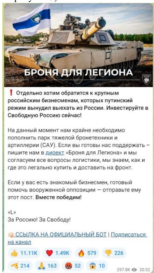
Рисунок 3 — Скриншот телеграм-канала легиона «Свобода России» с призывом к финансированию

4) структурное подразделение Минобороны Украины легион «Свобода России» (признан террористической организацией по решению Верховного Суда Российской Федерации от 16.03.2023 г. № АКПИ23-101С). Цель организации заключается в подрыве государственности, территориальной целостности и конституционных основ нашей страны. Немалая часть боевиков указанных военизированных формирований является праворадикалами и неонацистами по своим идеологическим убеждениям. Опасность данных организаций заключается, с одной стороны, в соучастии в убийстве российских военнослужащих в зоне СВО, с другой стороны, в попытках вовлечения российской молодежи в противоправную деятельность: поджоги военных комиссариатов, нападения на правоохранительные органы, совершение диверсий, а также финансирование украинских вооруженных сил (ВСУ) (см. рисунок 3).