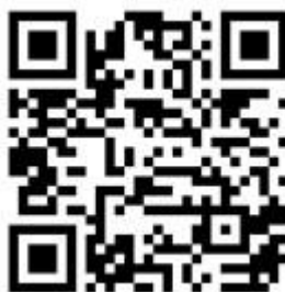
Рисунок 6 — Рекомендации по проведению кинопоказов в профилактике

Среди фильмов по тематике противодействия терроризму можно использовать следующие фильмы: «Беслан. Память» (Россия, 2014 г., возрастное ограничение: 12+), «Кавказский пленник» (Россия, 1996 г., возрастное ограничение: 18+), «Я не террорист» (Узбекистан, 2021 г., возрастное ограничение: 18+), «Отель Мумбаи: противостояние» (США, Австралия, 2018 г., возрастное ограничение: 18+) и т.д.