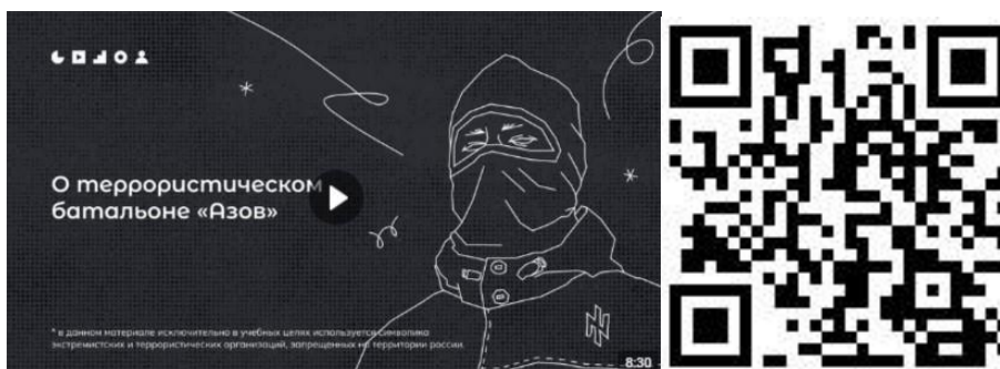
Рисунок 2 – Видеоролик, разъясняющий причины признания организации террористической

4) структурное подразделение Минобороны Украины легион «Свобода России» (признан террористической организацией по решению Верховного Суда Российской Федерации от 16.03.2023 г. № АКПИ23-101С). Цель организации заключается в подрыве государственности, территориальной целостности и конституционных основ нашей страны. Немалая часть боевиков указанных военизированных формирований является праворадикалами и неонацистами по своим идеологическим убеждениям. Опасность данных организаций заключается, с одной стороны, в соучастии в убийстве российских военнослужащих в зоне СВО, с другой стороны, в попытках вовлечения российской молодежи в противоправную деятельность: поджоги военных комиссариатов, нападения на правоохранительные органы, совершение диверсий, а также финансирование украинских вооруженных сил (ВСУ) (см. рисунок 3).