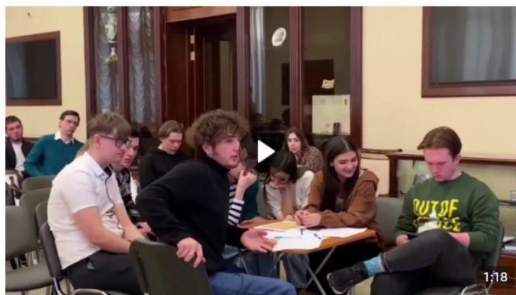
Дебаты «Идеология радикальных организаций» 1 888 просмотров

В рамках дебатов можно: развенчивать мифы, декларируемые представителями радикальных идеологий для вербовки; развивать навыки критического мышления и ведения дискуссии; формировать в целом антитеррористическое сознание и активную гражданскую позицию. Рекомендуется для мероприятия вовлекать не более 20 человек (см. рисунок 5).