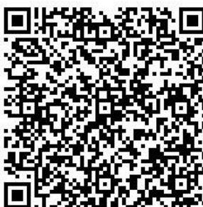
Рисунок 7 — Сценарий тематической викторины с примерами вопросов

Несмотря на игровой формат, ключевая цель мероприятия – профилактическая. Поэтому особый акцент стоит сделать именно на объявлении правильных ответов, поясняя их и отвечая на все возникающие вопросы (см. рисунок 7).