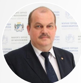
Ахметгареев Рамиль Миргазянович начальник департамента образования мэрии города Новосибирска